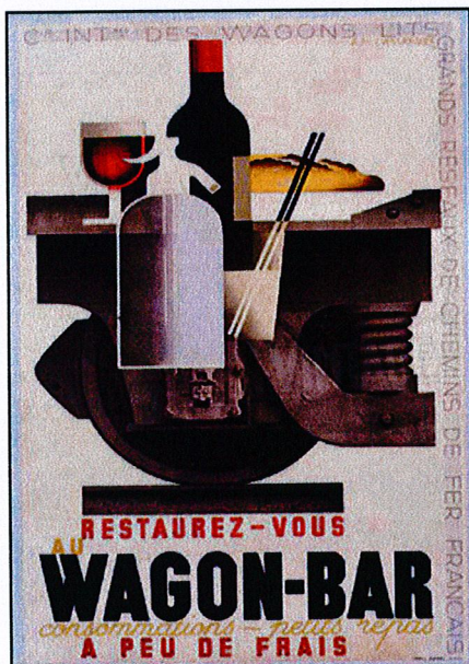
Cartel anunciador de vagón restaurante en trenes franceses.